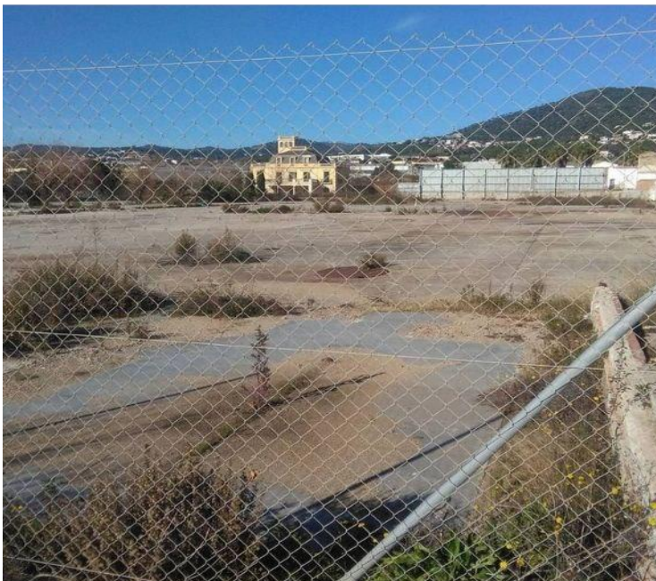
Antic espai de la fàbrica Metalogenia al Camí Ral

Fa temps reclamem una taula de sostenibilitat i urbanisme, perquè les modificacions que es fan a Premià s'han de contemplar en conjunt, "El territori és col·lectiu, està viu i és un ecosistema" (Agapit Borràs, 2022), nosaltres formem part, i també de les decisions. No pot ser que el govern no contesti les nostres al·legacions en els processos de debat. Però juguem la partida,