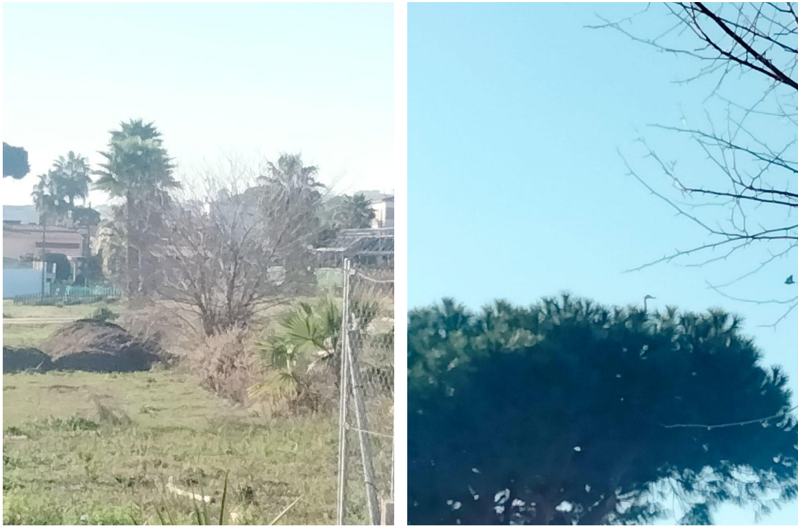
Vista parcial de l'espai Can Torrens- Can Buscarons i nidificació de cigonyes.

El projecte de Can Torrens - Can Buscarons , cavall dret, està en fase d'al·legacions, hi ha aprovats 300 habitatges, però s'haurien d'esponjar, augmentar les zones verdes i equipaments i estudiar la disposició dels edificis per qüestions de canvi climàtic, hidrologia i conservació del patrimoni cultural. S'han trobat diverses restes romanes, i de patrimoni natural, i és un lloc clau per cigonyes i orenetes.